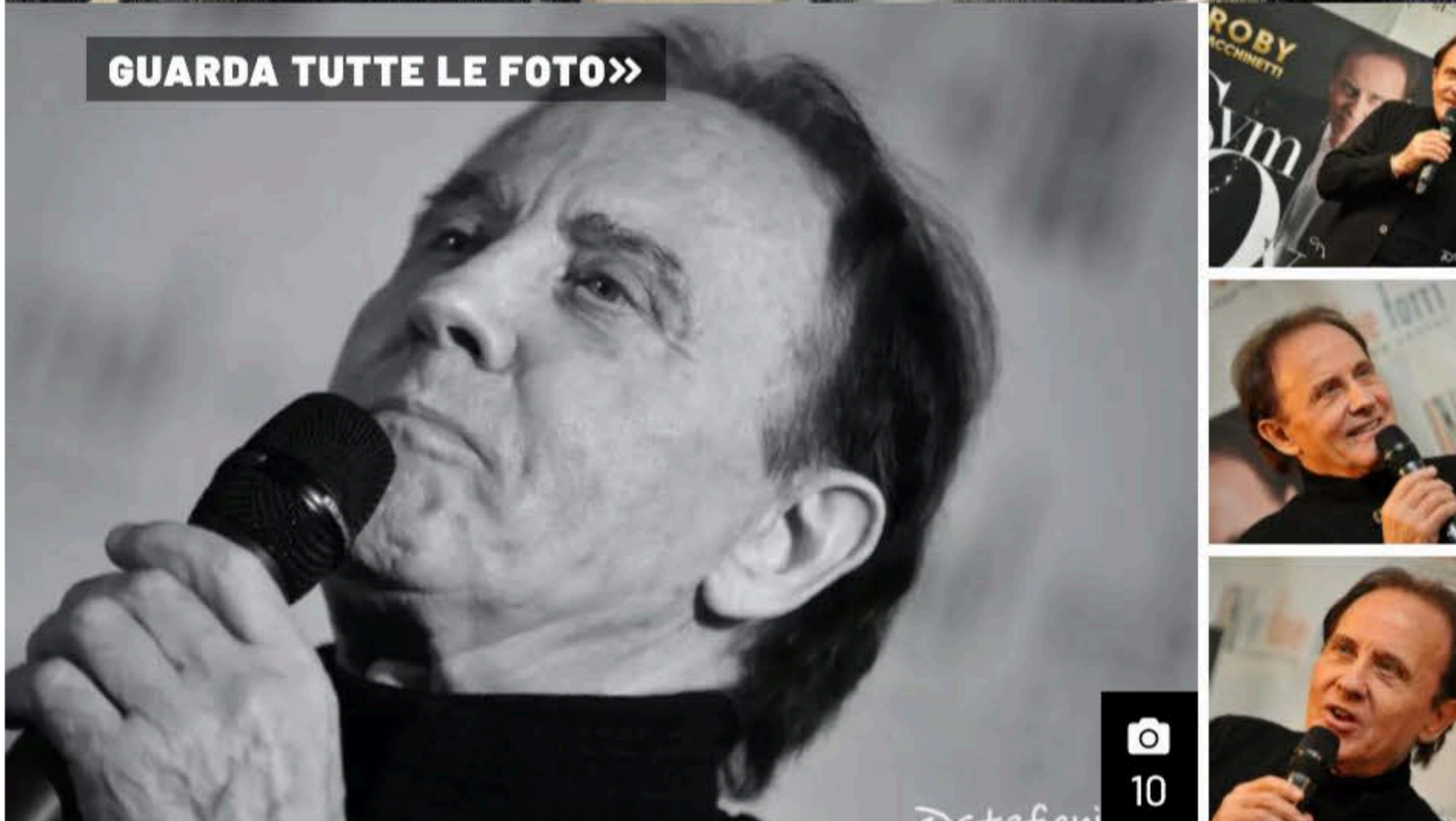
Roby Facchinetti presenta Symphony a Stezzano

La scelta di utilizzare le due orchestre arriva da lontano: "Mia madre quand'ero piccolo mi faceva ascoltare spesso l'opera, la musica classica e melodica, quindi ho ideato a questo progetto anche grazie a lei. Ci tenevo in modo particolare", ha spiegato. Prima di partire con gli autografi e le foto di rito, Roby Facchinetti si è lanciato in un pronostico sulla partita Juve-Atalanta. Da buon bergamasco ha dato la vittoria alla Dea per 2-0.