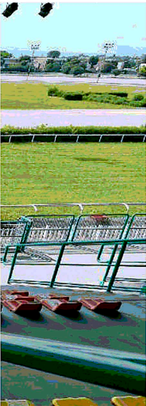
NUOVA ARENA L'ippodromo pronto ad ospitare i grandi concerti: a fianco i Subsonica che aprono il festival e qui sotto Nek